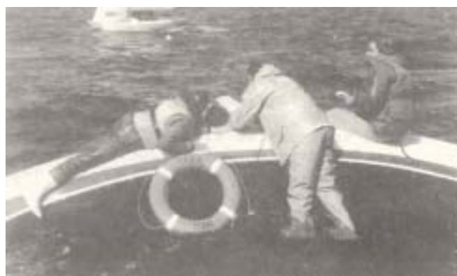
En kæntring af Hellerup's DEN 541 anno 1981. Fyren som står på kølen stoler åbenbart mest redningskransen, og mener dermed at kunne undvære redningsvest.