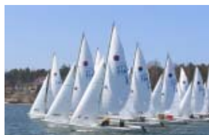
Varje onsdag är ålänningarna igång utanför Mariehamn. Träningen har gett utdelning: SM-guldet och silvret 2005.