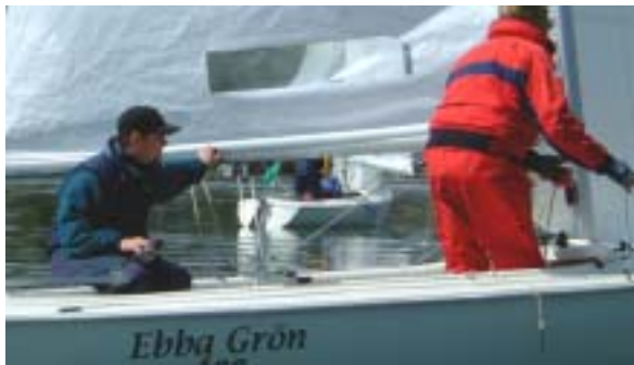
Ebba Grön på väg till finska fastlandet...