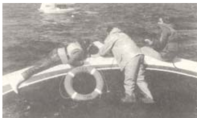
En kæntring af Hellerup's DEN 541 anno 1981. Fyren som står på kølen stoler åbenbart mest redningskransen, og mener dermed at kunne undvære redningsvest.