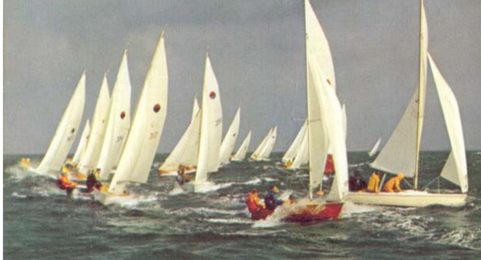
Billede fra Monark salgsbrochure. Fotografier er Ole Bundgaard og Jan Mark. Venligst stillet til rådighed af Jesper Sivertsen.