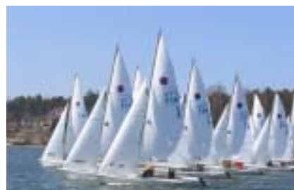
Varje onsdag är ålänningarna igång utanför Mariehamn. Träningen har gett utdelning: SM-guldet och silvret 2005.